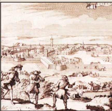
Jajca vára a török uralom alatt. Rézmetszet részlete, 17. század

1683–1699. Horvátország és nagyobbik része felszabadul a török uralom alól, míg a szárazföldi Dalmácia Velence kezére kerül.