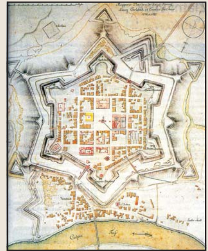
A mára elpusztult károlyvárosi erőd csillagot formázó alaprajza, 1774

1578. július A magyar–horvát védelmi rendszer irányításának 1578-ban történt kettéosztása után (az uralkodó a magyarországi végek kormányzását Ernő főhercegre, a horvátországi és szlavón végeket Károly főhercegre bízta) Károly főherceg a Kulpa és Korana folyók torkolatánál új erődítmény építésébe kezd. Az 1580-as évekre elkészülő Károlyváros (Karlovac) évszázadokra a török elleni déli határvédelem kulcsa lesz.