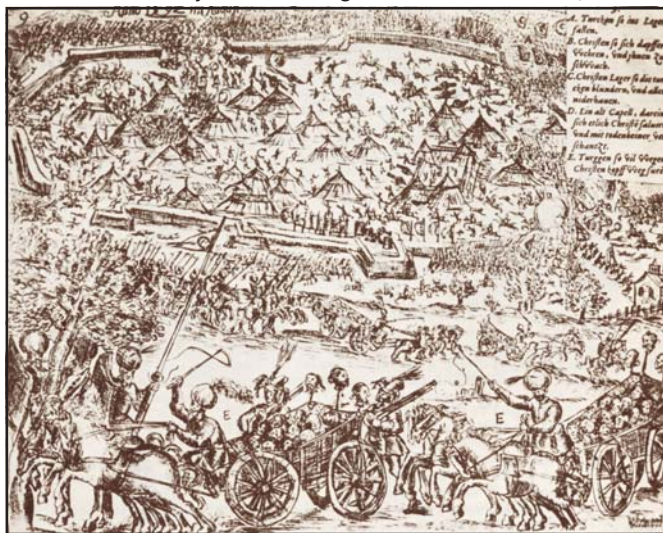
A török seregek győzelmi jelként levágott fejeket visznek szekérszámra. A Petrinja bevételét megőrkítő metszet részlete, 1592

1556-ban Hans Lenković személyében horvát–szlavón végvidéki főkapitányt nevezett ki az uralkodó, és az ő irányítása alá került az 1559-ben reformált végvárrendszer és az örökös tartományok által fizetett katonaság. A bán hatásköre erősen beszűkült, a gyenge harcértékű nemesi felkelés és a vármegyei csapatok mellett csupán a 400-500 fős báni bandé-