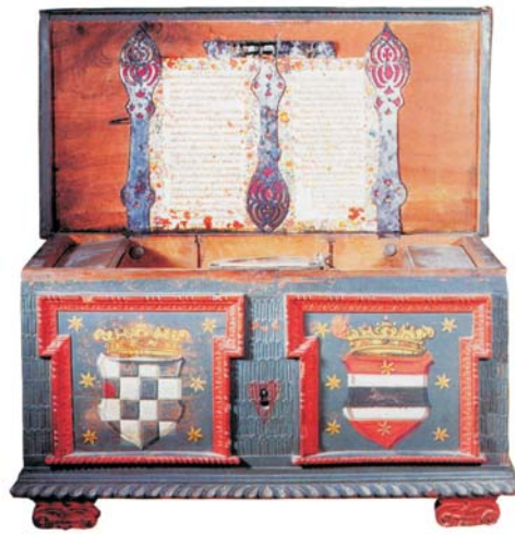
A horvát-szlavón országláda, előlapján a horvát és a szlavón címerrel, tetején Szakmárdy János epigrammájával, 1643

A lakosság különböző dialektusú délszláv nyelven beszélt, míg a nemesség etnikailag kevert volt, akiket összekötött az egyetemes latin kultúra és írásbeliség, valamint az a markáns hungarus tudat , mely alapján a „ natio Hungarica ” tagjai közé számították magukat. A szlavón nemesség osztozott a Rákos mezejére összegyűlő magyar köznemesség Jagelló-kori németellenességében is, és velük összhangban fogadta el Szapolyai János királyságát a mohácsi csata utáni hónapokban. Nem merült fel bennük, hogy közösen a Magyar Királyságon kívül keressék a boldogulásukat, ezt sem a történelmi hagyományok, sem a Szent Koronához való tartozás tudata nem engedte, és hiányzott bármilyen tartományi önállóságot megjelenítő ideológia, illetve ennek reprezentációs eszköztára is. Mindezek ismeretében kell feltennünk