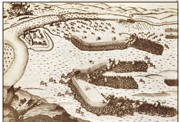
A sziszeki csata, 1593. Rézmetszet részlete

1593. A horvát–szlavón rendek zágrábi gyűlésén (április 12.) kiderül, hogy két év alatt a török 26 várat foglalt el és 35 ezer embert vitt rabságba. – Erdődy Tamás horvát bán osztrák csapatokkal