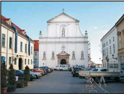
A jezsuiták által emelt Szent Katalin-templom Zágrábban, szemben a jezsuita rendházzal és iskolával, 1630

1606. október 28. A zágrábi jezsuita missziós állomás állandó rezidenciává válik, ahol iskolát is nyitnak. Az 1612-től kollégiumként működő zágrábi rendház a horvát barokk művelődés egyik fontos központja a 17–18. században.