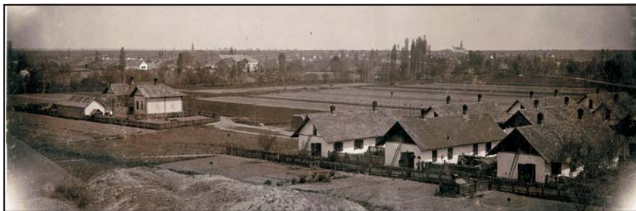
Bányászkolónia a pécsi szénmedencéhez tartozó Mányoknál, 1900 körül

zett Rajiç kiáltványban tudatta Pécs polgáraival, hogy a helyi szocialista párt kívánságára, amely az egykori pécsi Nemzeti Tanács legnagyobb pártja, megengedi, hogy a Nemzeti Tanácsot népgyűlés útján újraválasszák. Ez pedig általános választás kiírásával megalkítja majd a törvényhatósági bizottságot a város ügyeinek intézésére. A 20 ezer főre becsült tömeg augusztus 8-án a Majláth téren választotta meg a 34 szocialista, 15 polgári radikális és 3 párton kívüli tagból álló Nemzeti Tanácsot.