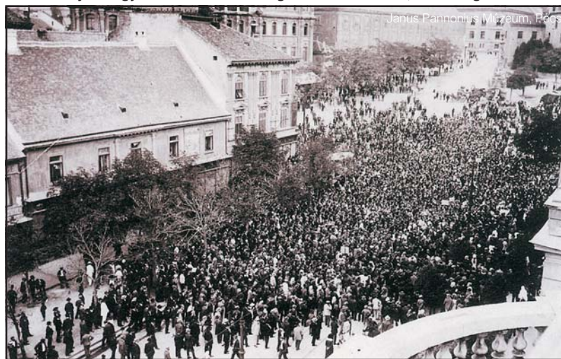
A Baranyai Magyar-Szerb Köztársaság kikiáltása Pécsen, 1921. augusztus 14.

A Tanácsköztársaság bukását követő időszakban a szerb hatóságok várakozó álláspontra helyezkedtek. Úgy tűnt, mindegy volt nekik, hogy mi történik a városban, csak rend legyen, meg szén. És persze igyekeztek elodázní a területkiürítést. Előbb a szerbiai szénellátás problémáira hivatkozva azt akarták elérni, hogy legalább a szénbányákat ne kelljen elhagyniuk, majd 1919 októberében területi többletkövetelésekkel is előálltak. A kiürítés ellen felhozták a megszállt területek délszláv lakosságának csatlakozási óhaját, akiknek távozásuk esetén sem személyi, sem vagyoni biztonságát nem látták garantálva. Állításaik szerint 30 ezer baranyai állt készen otthona elhagyására, amennyiben a délszláv katonaság innen visszavonul. Zsarólassal felérő kijelentéseket tettek, miszerint a kiürítés nyomán várhatóan elmaradó pécsi