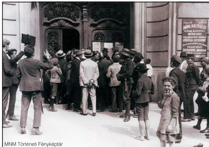
MNM Történelmi Fényképtár

A Gosset-misszió megérkezése után a helyi délszláv vezetők, vélhetően katonai körök egyetértésével, a magyarországi rendszer Pécsre és Baranyára történő kiterjesztésétől tartó, jórészt manipulált munkásság felhasználásával