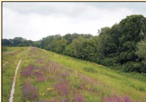
Jelöletlen tömegsír feltételezett helye Martonos határában

Szeretném, ha édesapámat tisztességesen el tudnám temetni és néha egy szál virágot helyezhetnék a sírjára.”