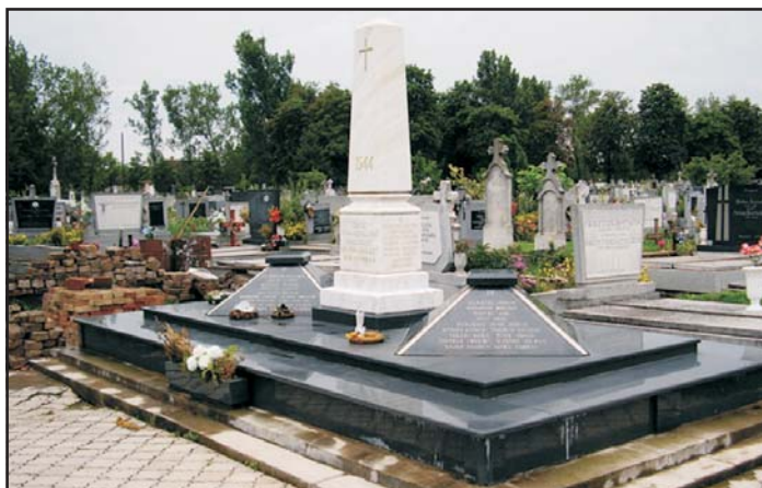
A kivégzett áldozatok emlékét őrzi a magyarkanizsai városi temetőben kialakított emlékmű