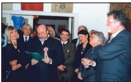
A társaság 25. évfordulója, 2005

gondolkodás, hanem az együtt evés is összehozza az embereket. Nem véletlen, hogy ez minden vallásban előjön. Ahogy egyik cikkemben meg is írtam: „Amikor együtt eszünk, megszenteljük az alkalmat. Nem véletlen, hogy a kereszténység is az ostyaáldozatot választotta. A communio, amikor mindenki osztozik a közös ételben, egyrészt az egyenlőségtudat képzetét, másrészt az összetartozás képzetét erősíti. Bár valójában a communio, együtt evés az