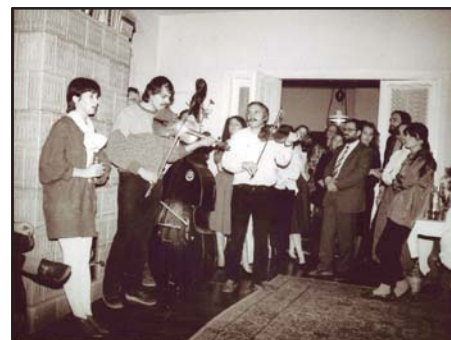
Sebestyén Márta és a Muzsikás együttes, az 1986-os év díjazottjai