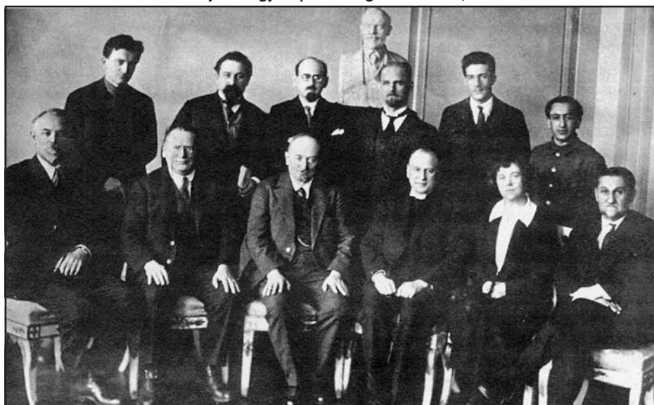
A szovjet külügyi népbiztosság munkatársai, 1926

Görögország mellett ekkor Albánia is lépéseket tett a Szovjetunió elismerésére. 1924. június 16-án, Albánia modern kori történetében először, polgári demokratikus kormány alakult az ortodox püspök, Fan Noli vezetésével. Az új albán hatalom a diplomáciai kapcsolatok felvételét a szovjet kormánnyal egy szeptember 4-i keltezésű hivatalos levélben mondta ki. A Noli-kabinet elismerésére a Kreml különös súlyt helyezett, hiszen Görögország mellett fő-