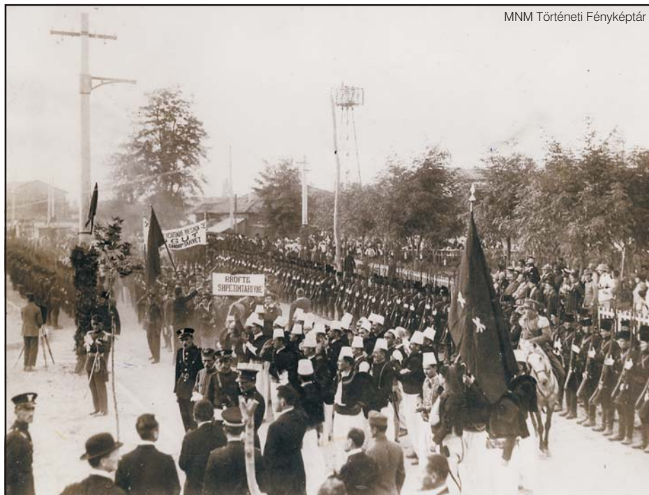
Ahmed Zogu albán király első katonai szemléjét tartja Tiranában, 1928

Az elismerési folyamat megindulásának – a kapitalista országok részéről – elsősorban gazdasági mozzanatokról volt szó. Az 1920–1921 folyamán több gazdaságpolitikai intézkedés együtteseként összeálló új gazdaságpolitika (NEP) hatására ténylegesen javultak a szovjet gazdaság mutatói, 1924–1925-re a termelés volumene már csaknem elérte a háború előtti utolsó békeév szintjét.