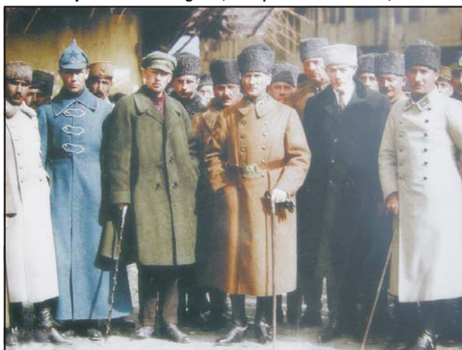
A törökök szovjet segítséggel űzték ki a görögöket Kis-Ázsiából és új békeszerződést kényszerítettek ki. Szovjet és török delegáció, középen Kemal Atatürk, 1922

figyelembe véve sokáig nem is gondolhatott nyílt expanzióra , szövetségi viszonyt kellett kialakítania a Fekete-tenger nyugati medencéje mentén fekvő országok különféle kormányzati rendszereivel. Emellett a tengerszorosok használatának nemzetközi szabályozásával igyekezett megakadályozni más érdekelt nagyhatalmak (Anglia, Franciaország, Olaszország) túlzott befolyását.