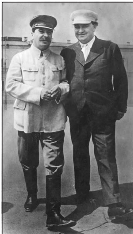
Sztálin és Dimitrov, 1936

A két világháború között a Balkán majd minden államában monarchikus rendszerek voltak hatalmon (Albániában 1928-tól). Az évek során szinte mindenhol végbement az uralkodói hatalom koncentrációja , a Szerb–Horvát–Szlovén Királyságban 1929-ben, Bulgáriában 1934-ben, míg Romániában 1938-ban. Az itteni uralkodó elitek kivétel nélkül úgy vélték, hogy a szovjet rezsím ideológiai alapállása fenyegetést jelent országuk társadalmi és politikai berendezkedésére. Sokáig idegenkedtek a Szovjetunió elismerésétől, sőt a legtöbb helyen betiltották a kommunista pártokat és kíméletlenül elfojtottak minden szélsőbaloldali szervezkedést.