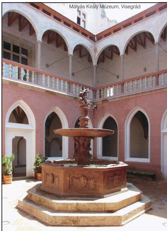
A Herkules-kút a visegrádi királyi palota díszudvarán (rekonstrukció)

A Mátyás kori arisztokraták a korábban vártnál, gondoltnál lényegesen kevesebbet forogtak a királyi udvarban vagy a király környezetében. Sőt, a jelek szerint nem is