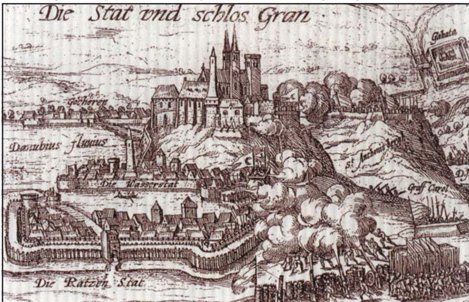
Az esztergomi vár épületei az 1595. évi pusztulás előtt. Franz Hogenberg metszetének részlete

1482 szeptemberében a pozsonyi városi számadáskönyvek arról tanús- kodnak, hogy a frissiben megszállt Hainburg (Ausztria) várába Beatrix királyné bútorokat és ágyneműt vite- tett az odarendelt udvari személy- zettel, láthatólag azért, hogy ott hosszabb-rövidebb időre maga is meg- szálljon. Ezután pedig alig lepődhe- tünk meg azon, hogy 1485 januárjának végén az asszonyoknak gyaníthatóan nem való bécsi ostromtáborban is ki- mutatható a királyi hitves jelenléte. Ráadásul a tábor elhagyása után sem tért vissza Budára vagy más királyi székhelyre, hanem Pozsonyban időz- ve, azaz újfent a közelben várta ki a város elestét. Ugyancsak a közeli Pozsonyban fogadta a friss híreket Mátyás 1486. szeptember-októberi harcairól, amiket az osztrák-morva határvidéken folytatott. Bécsújhely (Wiener Neustadt) ostroma alatt is ki- mutatható férje mellett 1487 nyarának derekáról.