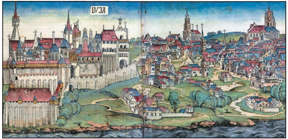
A Mátyás kori Buda Hartmann Schedel világkrónikájában. Színezett fametszet, Nürnberg, 1493

A vizsgálatok egy másik útját jelenti a király mozgásának összevetése más ha- talmi szereplők utazásaival, politikai működésével. Ezek sorában az egyik legérdekesebb a királyi feleségek sze- repe. Az 1300 előtti királynék jobbára a korban medium regnare nevezett területen, a Buda, Fehérvár, Eszter- gom által meghatározott háromszög- ben tartózkodtak, s csak kivételes alkalmakkor utaztak a királyság távoli pontjaira. Feltételezhetjük, hogy a höl- gyek a politizáló, hadakozó férfiaknál lényegesen kevésbé voltak utazó ked- vűek a Mohács előtti Magyarországon. Mátyás 1476-ban hazánkba érkezett fe- lesége, Beatrix esetében azonban a helyzet megváltozott. Noha a királyné életéről számos munka született, itine- ráriumvizsgálattal a róla alkotott képünket tovább színesíthetjük. A ku-