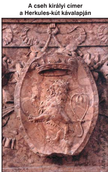
A cseh királyi címer a Herkules-kút káivalapján

vágytak túl sokat ott tartózkodni. Ez a megállapítás igaznak látszik akkor is, amikor a király hosszabban Buda várában él, és olyankor is, amikor távol van onnan, pl. hadjárat idején. Az 1460-as években a Szapolyai testvérek felváltva vezették a Felső részek (lényegében a mai nyugat- és közép-szlovákiai régió) védelmét a huszita támadók ellenében, míg közben Imre boszniai kormányzóként az évtized első felében a déli határok mentén utazott sokat. Ugyanekkor Pálóci László országbíró, amikor csak tehette, távoli, ekkortájt kiépített rezidenciáján, Patakon (ma: Sárospatak) pihent. Innen csak akkor mozdult ki, ha valamely fontos politikai, katonai esemény erre rákényszerítette. 1464-ben pl. csak Mátyás koronázása miatt hagyta el az ország keleti szegletét. Bő évti-