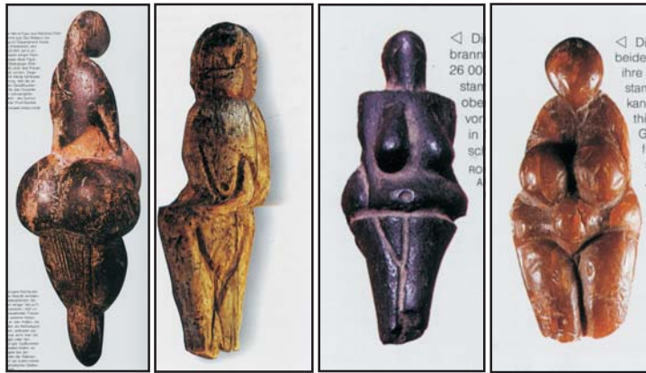
„Vénusz”-figurák a gravetti kultúra területéről

A 100. évforduló alkalmából a bécsi szakemberek újabb tüzetes vizsgálatoknak vetették alá a willendorfi „ős-