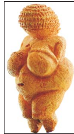
A „prehistorikus művészet ikonja”, a Willendorfi Vénusz

archeológusok szerint arra utalhat, hogy a gravetti kultúra emberei több mint 3000 km kiterjedésű területen hasonló kultuszokat ápoltak, kiterjedt kommunikációs rendszerben éltek.